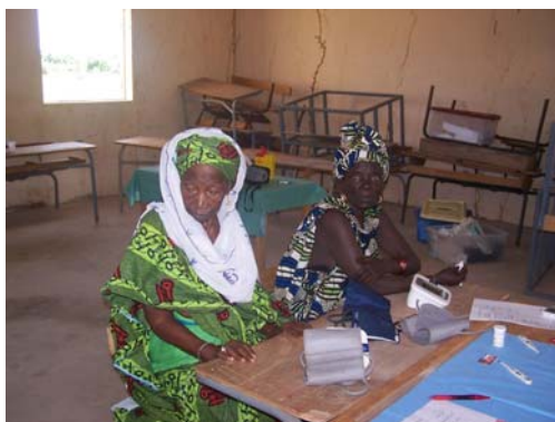
Pacientes en la consulta