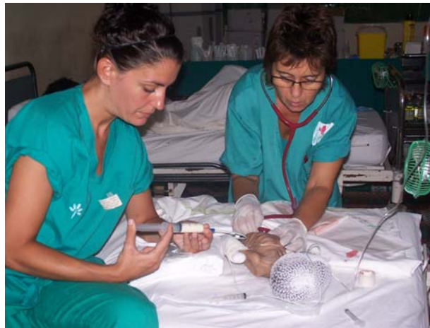
Cuidados de enfermería