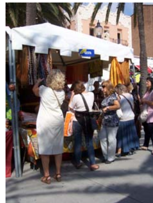
Feria de la Solidaridad, Badalona